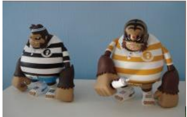
Herkenbaar en uniek

Vertrouwende op een gezonde discussie en een democratisch besluit. Het Bestuur