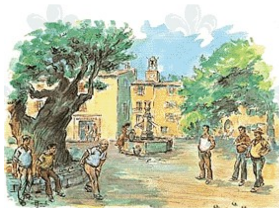
La partie de pétanque by Charles Homuak de Lille